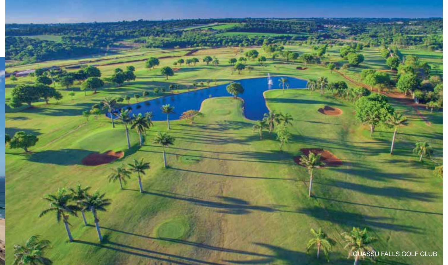
IGUASSU FALLS GOLF CLUB

Von Rio de Janeiro lohnt ein Abstecher nach Bahia, das sich ca. zwei Flugstunden nördlich befindet und flächenmäßig ungefähr so groß ist wie Deutschland, Österreich und Schweiz zusammen. Angefliegen wird Porto Seguro, von hier geht es eine kurze Autofahrt südlich nach Trancoso, einem kleinen Städtchen auf einem Hochplateau über dem Meer. Der erste Eindruck, man sei am Ende der Welt, täuscht, denn in Trancoso ist der brasilianische, aber auch internationale Jetset zu Hause, und Grundstückspreise entsprechend astronomisch teuer. Zentrum des kleinen Ortes ist das „Quadrado“, ein antikes Dorf mit bunten Häuschen, kleinen modischen Läden, die lokale Handarbeit anbieten, sowie ausgezeichneten Restaurants und stimmigen Bars. Tanzen und Musik sind hier Alltag und geben dem Örtchen sein unverwechselbares Flair. Die für Bahia typische Fisch- und Muschel-Moqueca sowie ein Glas Caipirinha schmecken hier besonders gut.