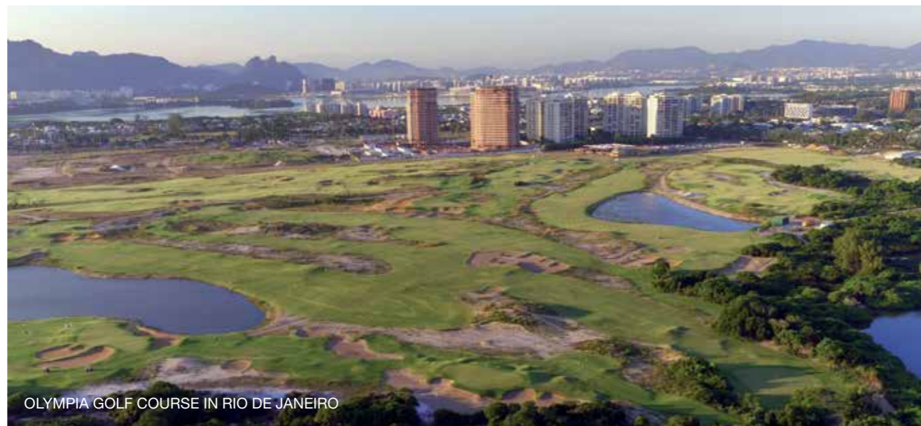
OLYMPIA GOLF COURSE IN RIO DE JANEIRO

Der ideale Hotel Tipp für den Rio-Aufenthalt ist das im Dezember 2016 eröffnete Luxushotel Gran Meliá Nacional Rio. Untergebracht ist es in einem spektakulären, avantgardistischen Hotelbau von Brasiliens berühmtestem Architekten, Oscar Niemeyer, aus dem Jahr 1972. Über 20 Jahre lang war es geschlossen, nun wurde es nach aufwendiger Komplettrenovierung wiederbelebt. Das Hotel überzeugt nicht nur durch seine imposante Architektur, die Fülle an Kunst, die es beherbergt, und seine imposante Höhe, es liegt auch in Sichtweite zum Gavea Golf Club und bietet spezielle Golfpakete an. Ansonsten sind Startzeiten für Gavea nur schwierig zu bekommen.