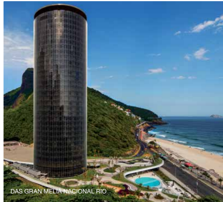
DAS GRAN MELIÁ NACIONAL RIO

Seit den Olympischen Spielen 2016, bei denen Golf erstmals nach 1904 wieder in die olympische Familie zurückkehrte, stehen dem Rio-Besucher drei Golfanlagen zur Verfügung. Zum einen natürlich der Olympiaplatz selbst, zum anderen die beiden älteren Plätze Itanhangá und Gavea, letzterer ist nur 30 Minuten von der Copacabana entfernt und einer der Top-Plätze Brasiliens. Diesen sehr traditionsreichen Platz muss man gespielt haben. Winden sich die ersten